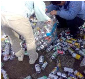
アルミ缶の分別作業↓