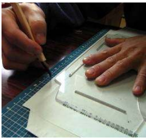
リサイクル封筒作り