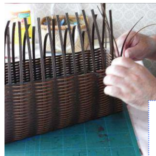
クラフトテープでかご作り

クラフトテープの籠で、サイズや柄などお客様のニーズにあったものを作らせて頂いております。